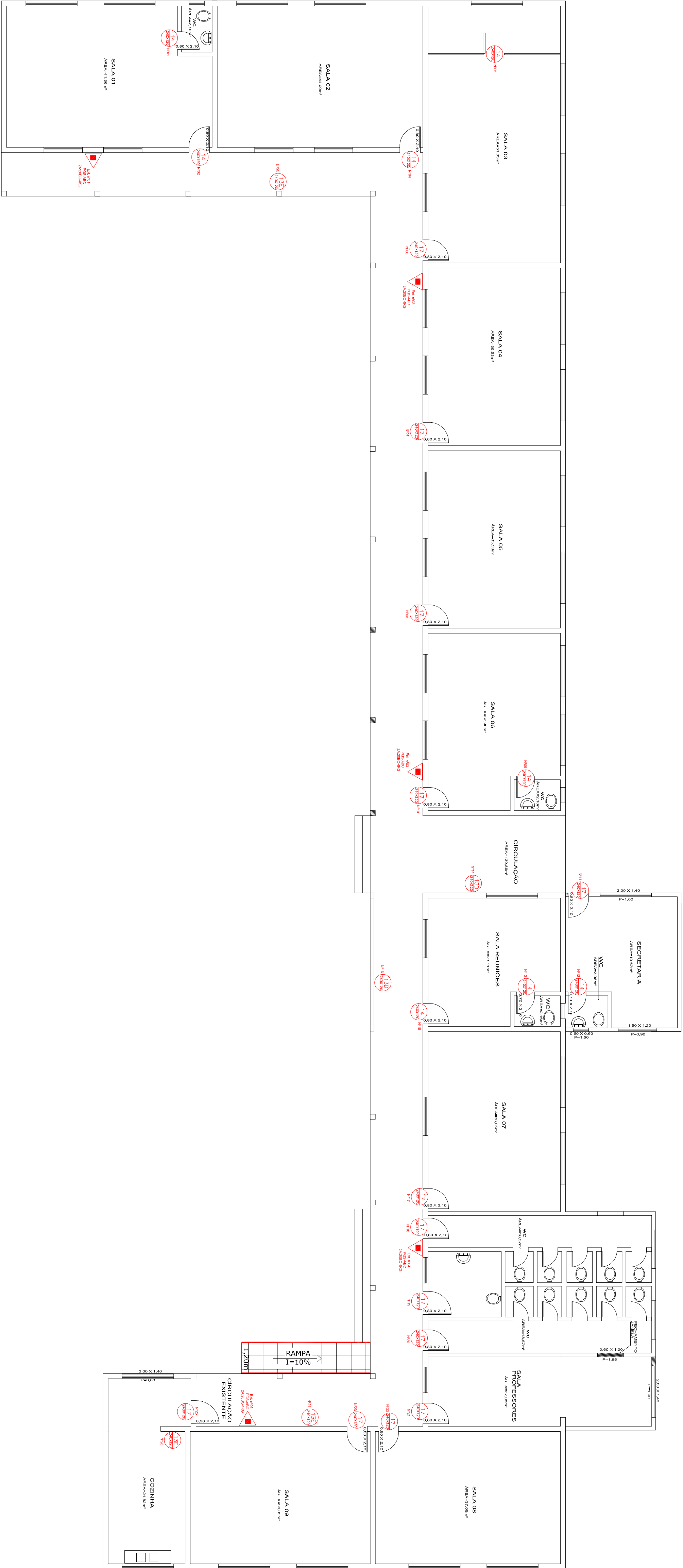
PLANTA BAIXA EMEB DR. ADOLPHO SEBASTIANY ESC. 1/100